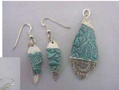
(釉薬の色は選べます) ←裏面はシルバーです。