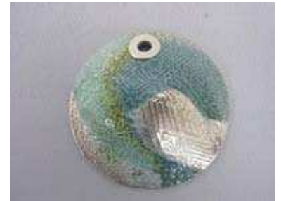
マーブルペンダント (デザインは自由です)