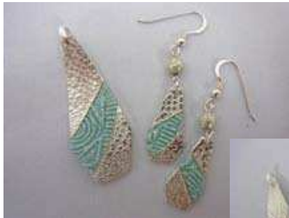
ペンダント&ピアス (デザインは自由です)